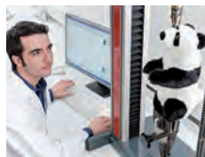
Beginn: 14:00, 15:00, 16:00 und 17:00 Uhr, Dauer: je 50 Min.

Anmeldung: rainer.weiskirchen@de.tuv.com