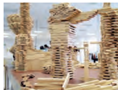
14:00-01:00 Uhr, Gebäude KB, EG und Treppenhaus