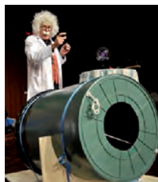
15:00-17:00 Uhr, große Aula

Show, Mitmach-Aktion ▶ Alter: ab 6 Jahren