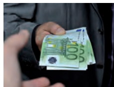
Experiment, 20:30 und 00:00 Uhr, Raum S 18

Die experimentelle Wirtschaftsforschung hat in den letzten 40 Jahren das alte Bild vom 'homo oeconomicus' durch die Erkenntnis rationalen Verhaltens ergänzt. Mit den Besuchern werden aus dem Stegreif Experimente nachgestellt, aus denen Sie über sich selbst erfahren können, inwieweit menschliche Intuition oder wirtschaftliche Rationalität Sie leiten.