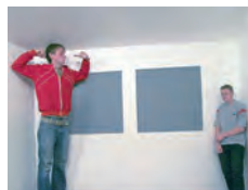
Installation, Experiment, 18:00-01:00 Uhr, Dauer: 60 Min., max. 30 Besucher

Erleben, Staunen und Be-Greifen im turmdersinne: Ist das, was wir wahrnehmen, wirklich immer wahr? In einem historischen Stadtmauerturm macht das interaktive Erlebnismuseum verblüffende Phänomene erlebbar. Die aktuelle Sonderausstellung „Art meets science“ bietet zusätzlich künstlerische Perspektiven: Wie beeinflusst etwa Farbe die menschliche Wahrnehmung? Wie werden Zeit, Raum und Bewegung in die Sprache der bildenden Kunst umgesetzt?