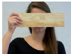
Interaktive Vorlesung, 20:00 und 23:30 Uhr, Dauer: je 30 Min., Raum S 18

Zittern, Erröten, Blackout. Sind Ihnen diese Symptome in Redesituationen bekannt? Es kann sich um Lampenfieber handeln, aber auch um Redeangst, die großen Leidensdruck bei den Betroffenen auslöst. Absolventen der EVHN widmen sich dem gesellschaftlichen Tabuthema und geben den Betroffenen Hilfestellung, Tipps und Tricks gegen das sprichwörtliche Brett vor'm Hirn. Sie sind eingeladen, mitzureden, sich einzubringen oder einfach nur zuzuhören.