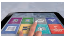
Ausstellung, Demonstration, 18:00-01:00 Uhr, Raum KH.013