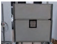
Demonstration, 18:00-01:00 Uhr, max. 15 Besucher, Raum KH.11

Hier zeigen wir Ihnen, wie eine Spraybildung bei herkömmlichen Common-Rail-Diesel-Injektoren stattfindet. Sie sehen, wie weit sich ein Spray im Brennraum verteilt und wie und warum man versucht, dies zu verbessern. Warum ist der Einspritzdruck ein wichtiger Faktor? Wie kann man eine bessere Zerstäubung und räumliche Verteilung erlangen? Wie beeinflussen der Druck und die Temperatur im Brennraum die Spraybildung? Wir wissen die Antworten.