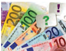
Mitmach-Aktion, 18:00-01:00 Uhr, Raum KA.128