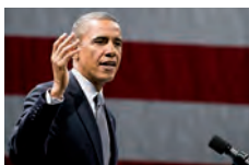
Vortrag, Podiumsdiskussion, 18:00 Uhr, Dauer: 90 Min., Raum 0.015