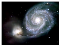
Infostand, 18:00-01:00 Uhr, Foyer

Die Nürnberger Astronomische Gesellschaft ist ein Zusammenschluss von Freunden und Förderern der Astronomie in der Metropolregion Nürnberg. Sie unterstützt die Zusammenarbeit aller, die die Öffentlichkeit an wissenschaftliche Erkenntnisse der Astronomie heranführen wollen. Aktuell beschäftigt sich die NAG schwerpunktmäßig mit der Förderung von Schulen in der Metropolregion und bereitet mit anderen Gruppen das Jubiläumsjahr 2014 des markgräflichen Hofastronomen Simon Marius vor.