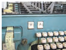
Demonstration, Mitmach-Aktion, 18:00-01:00 Uhr, alle 30 Min., Dauer: je 20 Min., Foyer

Digitalisierung ermöglicht den modernen Computer und liegt der neuzeitlichen Informationsverarbeitung zu Grunde. Symbol für schnelle Textübermittlung, Eingabemittel bei den ersten Großcomputern sowie Speichermedium war der Lochstreifen. Lassen Sie sich faszinieren von der Umsetzung Ihrer Texteingabe in einen 5-Loch-Code! Schnittmodelle mechanischer Rechenmaschinen und frühe elektronische Objekte ergänzen den Blick in die „Vergangenheit“ der Zukunft.