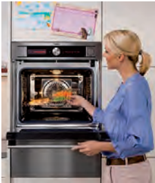
Demonstration, Vorführung, 18:00-01:00 Uhr