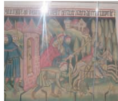
Lesung, Show, 19:30 Uhr Dauer: 45 Min., C-Turm 603

Rund um seine Heiligensprechung 1425 haben die Nürnberger die fiktive Vita ihres großen Stadtpatrons in Legenden, auf Teppichen, Bildern und den Reliefplatten am Sebaldusgrab auskomponiert. Im Rahmen der zweitägigen Veranstaltung „Verknüpfte Texte – Bildergeschichten und ihre Erzählstoffe“ wird in diesem ersten Teil die Legende des Sankt Sebald im Dialekt und Lautstand von ca. 1400 verlesen; dazu werden die entsprechenden Bildszenen zu sehen sein.