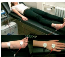
Mitmach-Aktion 18:00-24:00 Uhr, Foyer

Können Sie sich vorstellen, welche Veränderungen und körperlichen Einschränkungen im Alter auf Sie zukommen? Altern ist ein natürlicher Prozess und geht mit physiologischen Veränderungen u.a. der Sinnesorgane und des Bewegungsapparates einher. Der damit verbundene Funktionsverlust und die nachlassende Kraft erschweren die alltäglichen Tätigkeiten und sind für jüngere Menschen oft nicht vorstellbar. Das Instant Aging ermöglicht Ihnen einen Einblick in die körperliche Verfassung älterer Personen und soll für das Thema „Altern“ sensibilisieren.