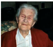
Mitmach-Aktion 18:00-24:00 Uhr, Foyer