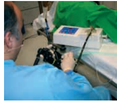
Demonstration, Mitmach-Aktion 18:00-01:00 Uhr K2

Nach viel Erfahrung in der medizinische Fortbildung mit lebenssechten Bio-Simulationsmodellen hat die ECE GmbH mit endodrive ihr erstes CE-zertifiziertes Medizinprodukt für die Endoskopie (Stabilisierung des Bildes, Fußpedalsteuerung, beidhändige Bedienung des Endoskopes) entwickelt. Besondere Bedeutung hat endodrive bei der Prävention des kolorektalen Karzinoms, da mit diesem System bei der Koloskopie mehr Befunde entdeckt werden können. Erleben Sie Live-Demos einer Koloskopie (Endo-Trainer-Modell + endodrive) und nutzen Sie die Möglichkeit, unter realistischen Bedingungen selbst das Endoskop in die Hand zu nehmen und eine „Probefahrt“ zu machen.