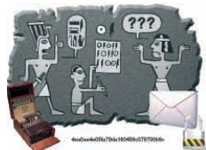
Gespräch: 18:30-00:30 Uhr Präsentation: 19:00-01:00 Uhr, alle 60 Min., Dauer: je 20 Min.

Wenn Sie schon immer einmal wissen wollten, mit welchen Techniken heute und in der Vergangenheit eine sichere Kommunikation hergestellt wurde, erfahren Sie dies hier in Präsentationen und Gesprächen mit Fachleuten aus der IT. Es werden Chiffriermethoden wie die historische Cäsar-Chiffre bis hin zu heutigen Standards für die Verschlüsselung von E-Mails vorgestellt. Zudem haben Sie die Gelegenheit, sich selbst an der Entschlüsselung verschiedener Texte zu erproben.