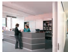
Präsentation 18:00-01:00 Uhr

Für welchen Beruf soll ich mich entscheiden? Das fragen sich viele Jugendliche nach dem Schulabschluss. Gute Entwicklungschancen bieten beispielsweise die Berufe in der Gesundheitswirtschaft. Die IHK informiert in der Wissenschaftsnacht über Inhalte, Ablauf und Karriere-chancen der einzelnen Berufe.