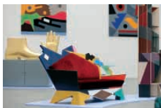
Führung, 19:30-23:30 Uhr, alle 60 Min. Dauer: 20 Min., max. 20 Besucher, Ausstellungssaal